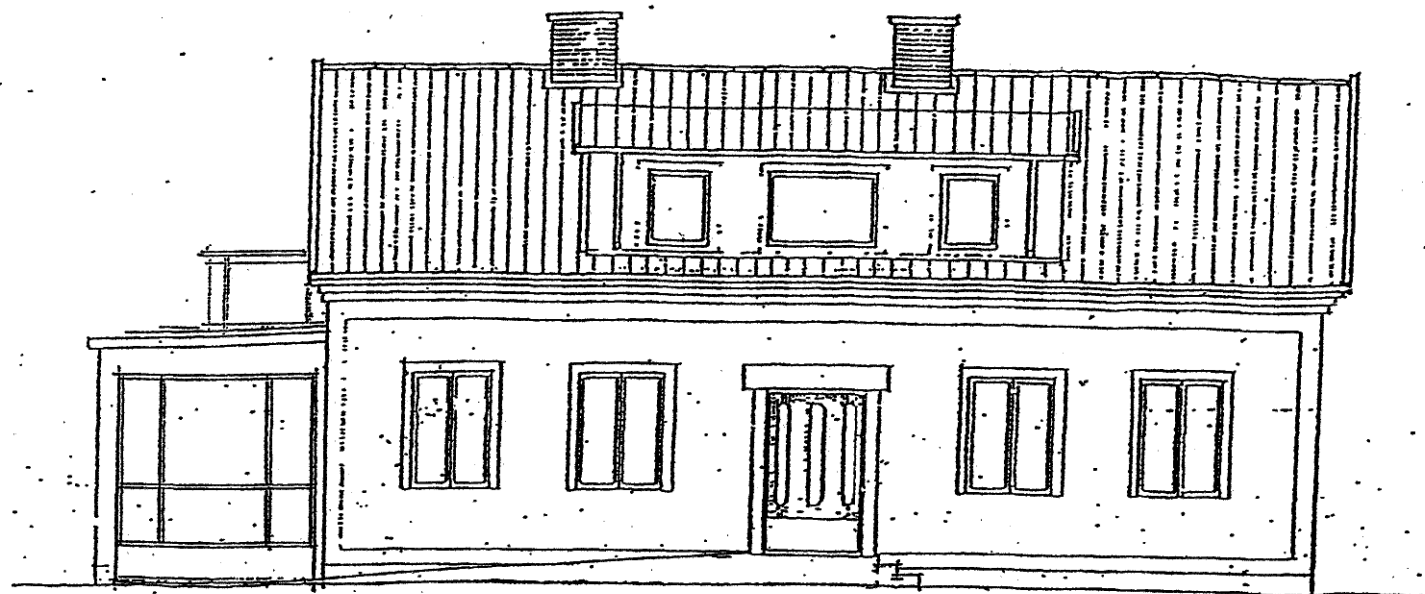
FASAD MOT GÅRDEN