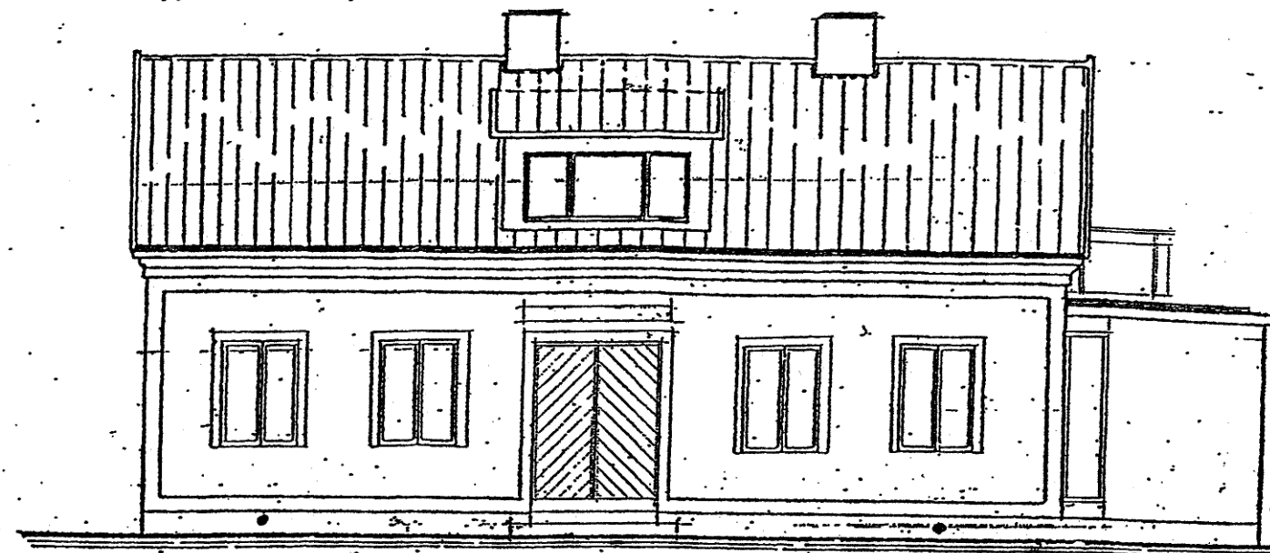
fasad mot torrgatan